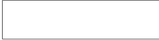
Схема границы балансовой принадлежности

е) границей эксплуатационной ответственности объектов централизованной системы холодного водоснабжения организации водопроводно-канализационного хозяйства и заказчика является: